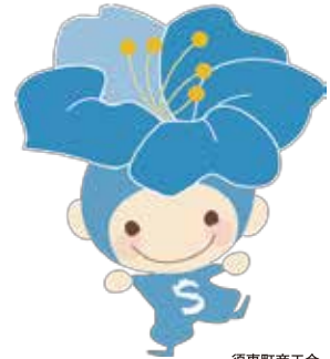
須恵町商工会 キャラクター さくぞう